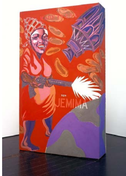
Derecha La nueva Jemima , 1964, 1970. Acrílico en lienzo sobre construcción de madera contrachapada, 102 3/8 × 60 3/4 × 17 1/4 in. (260 × 154.3 × 43.8 cm). The Menil Collection, Houston. © Patrimonio de Joe Overstreet/Artist Rights Society (ARS)