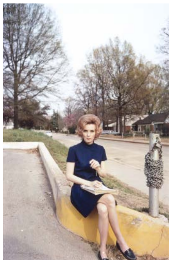
William Eggleston, Sin título , de La guía de William Eggleston , ca. 1969-71, publicada en 1976. Impresión por imbibición de tinta (transferencia de tinta). 21 x 13 1/2 in. (53.3 x 34.6 cm). The Menil Collection, Houston, regalo de Walter Hopps.

fotógrafos como Henri Cartier-Bresson. Cuando empezó a trabajar como asesor del Menil Foundation, en 1980, Hopps descubrió más de 400 fotografías de Cartier-Bresson, de todas las etapas de la carrera del fotógrafo francés, ya coleccionadas por los de Menil. Viendo a Evans como el contrapunto estadounidense de Cartier-Bresson, Hopps se propuso crear una colección igualmente sustancial de la obra de Evans, añadiendo 150 grabados de época a las tenencias de Menil.