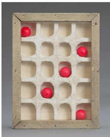
Joseph Cornell, Descartado , 1954-56. Vidrio, pintura, madera y pelotas de goma, 14 x 10 1/2 x 2 1/2 in. (35.6 x 26.7 x 6.4 cm). The Menil Collection, Houston, regalo anónimo en honor a Walter Hopps. © The Joseph and Robert Cornell Memorial Foundation / VAGA en la Artists Rights Society (ARS), NY.

Dos años después de la inauguración de Menil Collection, Hopps renunció a sus funciones administrativas para centrarse en lo que más le gustaba: organizar exposiciones que aprovecharan la fortaleza de la colección permanente del museo y explorar la comunidad artística que lo rodeaba. Su exposición Joseph Cornell / Marcel Duchamp... en resonancia reveló las conexiones entre los artistas al tiempo que recordaba dos de los logros curatoriales más célebres de Hopps: las retrospectivas de Duchamp y Cornell en el Pasadena Museum of Art unos treinta años antes. Al mismo tiempo, Hopps apoyó a la floreciente comunidad artística de Houston, fomentando las relaciones con artistas activos en el área, como Mel Chin y Terrell James , entre muchos otros