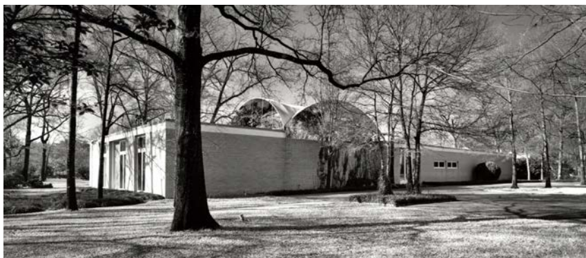
La casa de Menil.

Los de Menil hicieron de Houston su residencia principal a finales de la década de 1940, tras mudarse de Francia a Estados Unidos durante la Segunda Guerra Mundial. La casa moderna de la pareja, diseñada por el arquitecto Philip Johnson, pronto se convirtió en el hogar de sus intereses coleccionistas dispares, sus proyectos educativos y exposiciones y sus iniciativas filantrópicas. A principios de la década de 1960 ya era un centro de actividad para estudiantes universitarios, artistas visitantes y la comunidad artística floreciente de Houston. Un interior lúdico, diseñado por el modisto Charles James, fue el escenario de la exposición siempre cambiante –y en rápido crecimiento– de la colección de objetos de arte de todo el mundo de los de Menil. Entre principios de la década de 1950 y finales de la de 1990, un período marcado por la mudanza de los de Menil a su nuevo hogar y la muerte de Dominique de Menil, la casa y la colección fueron objeto de numerosos artículos en revistas y ensayos fotográficos. Por ejemplo, las fotografías del interior, realizadas por Balthazar Korab, ilustraron el reportaje de Vogue de 1966 «Collector's House: The de Menil's Affair with Art» (La casa del coleccionista: el romance de los de Menil con el arte), escrito por el entonces director del MFAH, James Jonhson Sweeney. Las fotografías de Korab transmitían claramente lo que Sweeney denominaba el «affair» o amor por el arte de los de Menil.